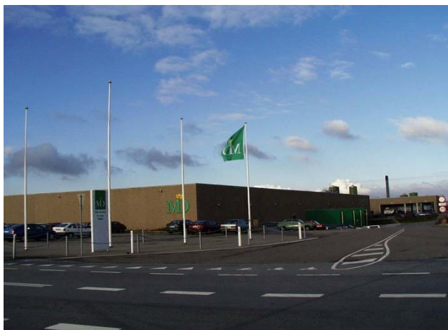
Завод Vium в Дании

История компании ARLA FOODS начинается с 1882, когда несколько самостоятельных молочных фермерских хозяйств объединились в один кооператив. С тех пор концерн ARLA FOODS стал крупнейшим изготовителем молочной продукции в странах Скандинавии, поставляющим продукцию на рынки более чем 100 стран мира. Штат компании насчитывает 16 000 сотрудников. Завод Vium в Дании производит 30 000 тонн сыра (марки Esrom, Havarti) перерабатывая более чем 300 000 тонн молока.