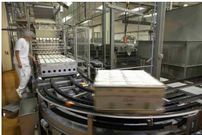
Линия по производству сыра

Контроль и управление производством обеспечивается 30 контроллерами Siemens (S7-300 и S7-400), которые связаны с системой IGSS посредством сети Ethernet.