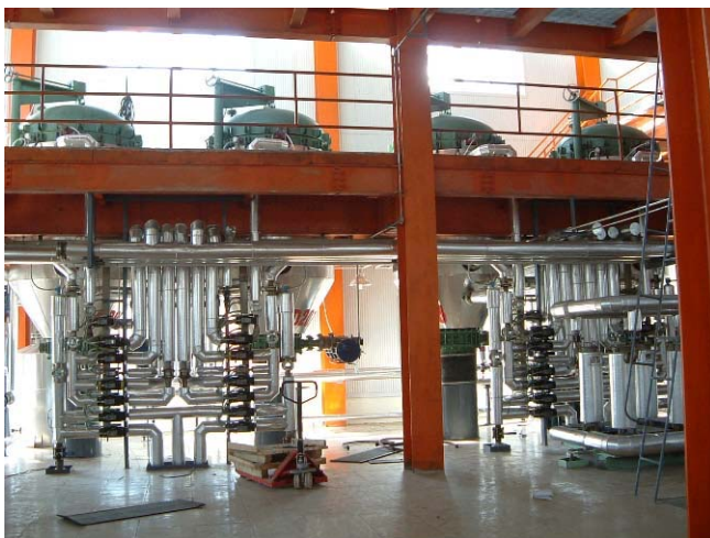
Сушильные установки на заводе Full Норе

Владельцем данного перерабатывающего завода является компания Full Норе Пекин, Китай.