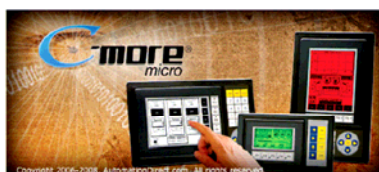
C-more Micro-Graphic 3" 6"