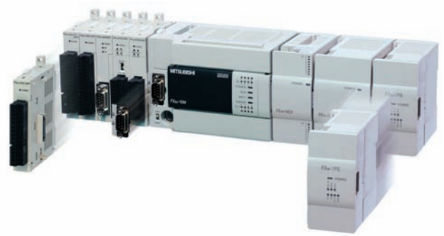
Блочная конфигурация Melsec FX позволяет использовать эти программируемые логические контроллеры в малых, средних и больших АСУ с общим количеством входов/выходов от 10 до 354

Модель DL05 имеет 14 встроенных каналов дискретного ввода/вывода (8 входов/6 выходов), один